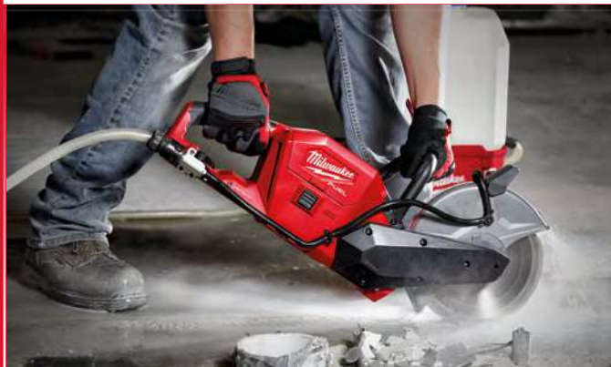
M18 FCOS230-0 REF. 4933471696