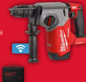
M18 ONEFHX-0 REF. 4933478502 341,90€ SIN IVA