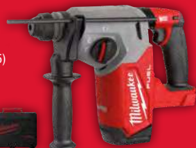
M18 FH-0 REF. 4933478499 285,90€ SIN IVA