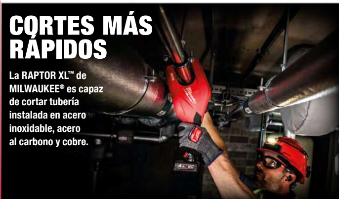
M12 PCSS54-0 REF. 4933498374

La RAPTOR XL™ de MILWAUKEE® es capaz de cortar tubería instalada en acero inoxidable, acero al carbono y cobre.