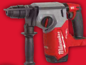
M18 FHX-0 REF. 4933478887 316,90€ SIN IVA