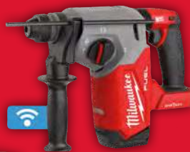
M18 ONEFH-0 REF. 4933478895 316,90€ SIN IVA