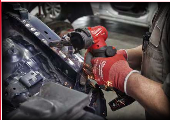
M12 FBFL13-0 REF. 4933480960