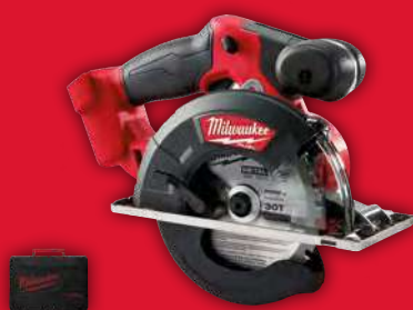
M18 FMCS-0 REF. 4933459191 285,90€ SIN IVA