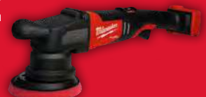
M18 FROP15-0 REF. 4933499156 363,90€ SIN IVA