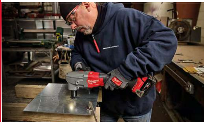
M18 FNB35-0X REF. 4933498982