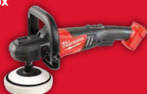
M18 FAP180-0 REF. 4933451549 285,90€ SIN IVA