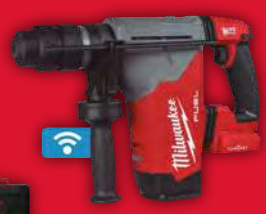
M18 ONEFHPX-0 REF. 4933478885 489,90€ SIN IVA